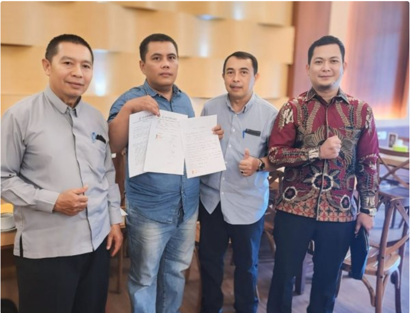
Kuasa Hukum Ningto Wahyu Dens & Partners Lawfirm di perkara Dugaan Pemalsuan Data dan Kredit Fiktif di Bank BRI Unit Kalideres.

JAKARTA, JNI - Seorang bekas nasabah Bank BRI, yang dikenal dengan inisial NW, melaporkan dugaan pemalsuan data dan kredit fiktif yang melibatkan oknum